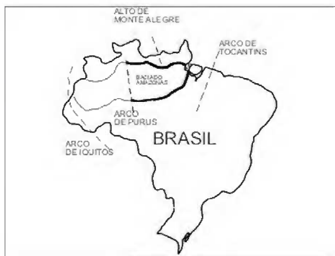
Fig. 1- Mapa de localização da Bacia do Amazonas, modificada de CARDOSO & QUADROS (2000).

Caiacorymbifer Tappan & Loeblich, 1971, p.390. Sinonímia anterior a 1973, ver EISENACK, CRAMER & DíEZ, Catálogo III, p.683.